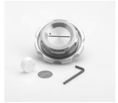
Specimen Holder รุ่น 3015G2