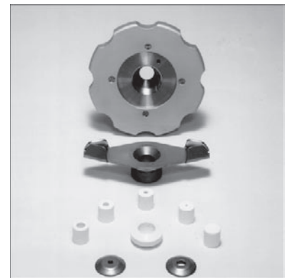
3015G4 標本ホルダーとシーリンググラメット、 シーリングスリーブ5個、補助ワッシャー 2個